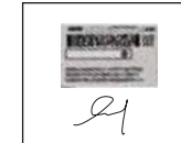
Imagen del reverso de tu credencial para votar, con tu firma AUTÓGRAFA debajo o a un costado

Imagen del anverso de tu credencial para votar con firma AUTOGRÁFA debajo o a un costado.