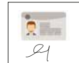
Imagen del anverso de tu credencial para votar con firma AUTOGRÁFA debajo o a un costado.